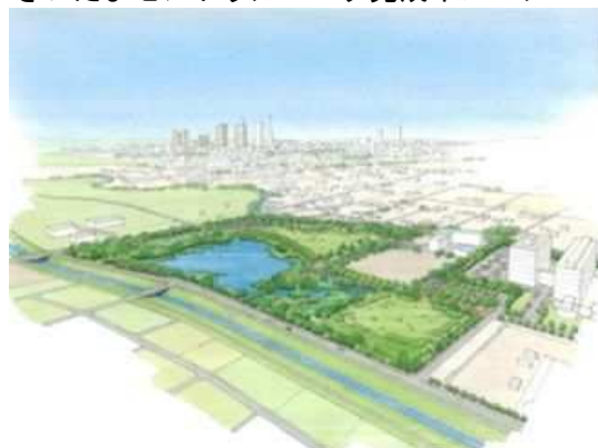
さいたまセントラルパーク完成イメージ

また、良好な住環境形成、災害のリスクや新しい生活様式への対応といった観点から、自然環境が有する様々なグリーンインフラの機能を効果的に活用することが重要です。